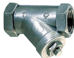
Snavssamler med gevind. Syrefast stål AISI 316 Vatech nr. 449129.0xx