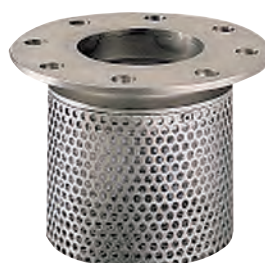
Bundsdi med flange. Hus af rustfrit stål AISI 304. Si af rustfrit stål AISI 304 Vatech nr. 435998.0xx