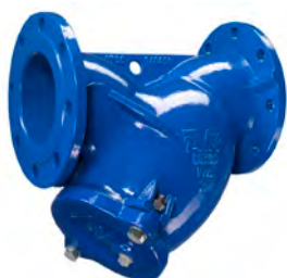
AVK Snavssamler med flanger. Hus af epoxybelagt støbejern. Si af rustfrit stål AISI 304 Vatech nr. 449125.0xx