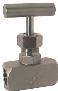
Syrefast nåleventil. AISI 316 Vatech nr. 410082.0xx