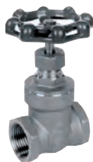
Vatech skydeventil af syrefast stål. Metaltættende. Med gevind. Vatech nr. 410081.0xx