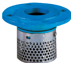
Bundsdi med flange. Hus af epoxybelagt støbejern. Si af galv. stål Vatech nr. 435997.0xx