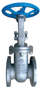
Vatech skydeventil af rustfrit syrefast stål. Med flanger. Metaltættende. Vatech nr. 410589.0xx