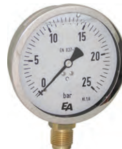
Glycerinfyldt manometer Ø 63 mm. Hus af rustfrit stål AISI 304. 1/4" tilslutning af messing. Nedad eller bagud. Vatech nr. 481150.0xx