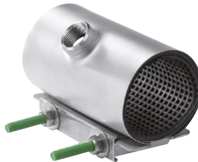
Rustfri bandagemuffe med gevindafgang. Enkeltrækket. Vatech nr. 101323.xxx