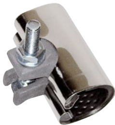
Rustfri reparationsklemme. Rustfrit stål AISI 304. Vatech nr. 101322.0xx