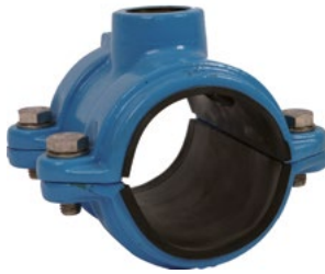
Anboringsbøjle for PVC-rør. Med indvendig gevind. Vatech nr. 063473.xxx