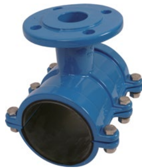
Anboringsbøjle for PVC-rør. Med flange Vatech nr. 063474.xxx