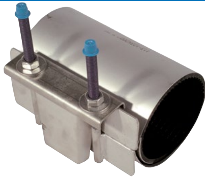
Rustfri bandagemuffe. Enkeltrækket. Vatech nr. 101319.0xx