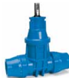
Serie 16/50 Med trækfast indstiksmuffe til PE-rør