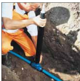
Standard AVK garniturer i teleskopisk og fast udførelse kan anvendes