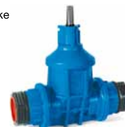
Serie 16/90 - Med PRK-koblinger