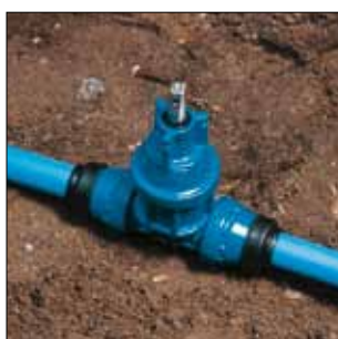
Serie 16/50 leveres med gummi-muffer som beskyttelse mod indtrængning af jord

Det nye program af plast stikledningsventiler i DN 25-50 til 32-63 mm rør leveres i 5 varianter: