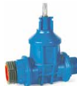
Serie 16/01 - Med PRK-kobling / udvendigt konisk rørgvind