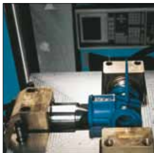
AVK Plastics BV anvender den nyeste teknologi til trykstøbning