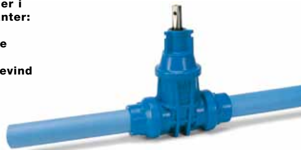
Serie 16/80 Med PE-ender for indsvejsning