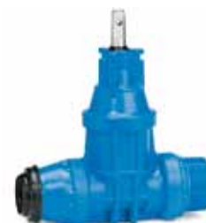
Serie 16/29 - Med trækfast indstiksmuffe til PE-rør / udvendigt konisk rørgvind