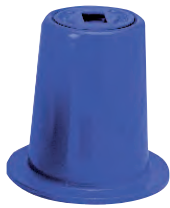
AVK stophanedæksel. Fast model. Vatech nr. 145155.380