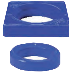
AVK mellemring og firkant til fast dæksel. Vatech nr. 145164-65.4xx