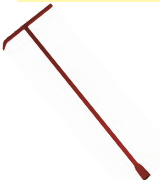
Vatech T-nøgle. Vatech nr. 145363.0xx