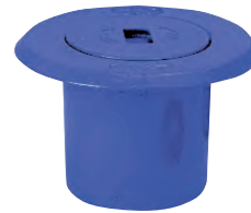
AVK stophanedæksel. Flydende model. Vatech nr. 145158.2xx