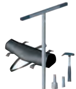
Vatech ergonomisk ventilnøgle. Standardsæt bestående af: T-greb 1,00-1,50 m forlængelse. Koblinger til stiklednings- og hovedledningsventiler. Hammer og skuldertaske. Vatech nr. 145416.001