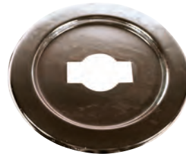
Vatech galvaniseret bærepåse for stophanedæksler. Vatech nr. 145286.0xx