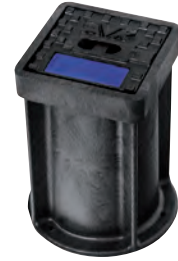
AVK stophanedæksel i plast Vatech nr. 145675.xxx