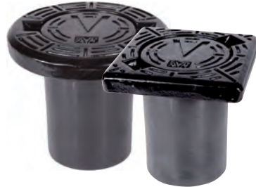
AVK Stophanedæksel. Komposit Vatech nr. 145670-71.xxx