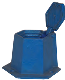
Vatech stophanedæksel. 6-kantet. Vatech nr. 145600.01x