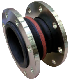
Vatech gummikompensator PN 10. Bælg af EPDM eller NBR. Flange af elgalvaniseret stål. Vatech nr. 435955.xxx