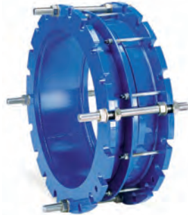
Vatech ekspansionsstykke serie 265/30 Hus af epoxybehandlet stål. Forskydelig: +/- 60 mm. Tætning af EPDM. Max. Arbejdstryk: 25 bar. Vatech nr. 141901.xxx