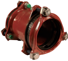
Multijoint 3000. Trækfast rørkobling. Tætning: EPDM. Syrefaste bolte A4. Vatech nr. 104251.xxx