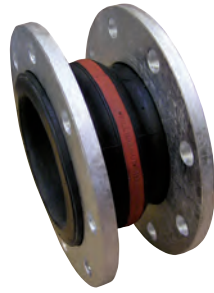
Vatech gummikompensator PN 10. Bælg af EPDM eller NBR. Flange af varmtgalvaniseret stål. Vatech nr. 435956.xxx