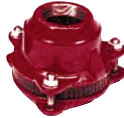
Multijoint 3000. Trækfast gevindkobling. Tætning: EPDM. Syrefaste bolte A4. Vatech nr. 104245.xxx