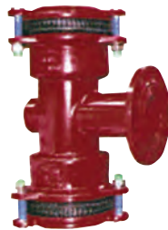
Multijoint 3000. Trækfast tee med flangeafgang. Tætning: EPDM. Syrefaste bolte A4. Vatech nr. 104126.xxx