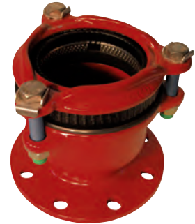
Multijoint 3000. Trækfast reduceret flangekobling. Tætning: EPDM. Syrefaste bolte A4. Vatech nr. 104256.xxx