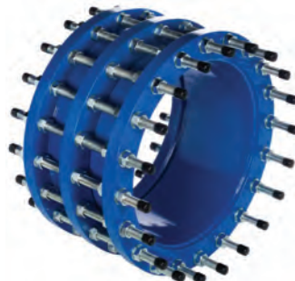
Vatech ekspansionsstykke serie 265/30 Hus af epoxybehandlet stål. Forskydelig: +/- 60 mm. Tætning af EPDM. Max. Arbejdstryk: 10 bar. Vatech nr. 141902.xxx