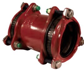
Multijoint 3000. Trækfast reduceret rørkobling. Tætning: EPDM. Syrefaste bolte A4. Vatech nr. 104252.xxx