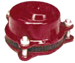
Multijoint 3000. Trækfast slutmuffekobling. Tætning: EPDM. Syrefaste bolte A4. Vatech nr. 104259.xxx