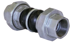
Vatech gummikompensator PN 10. Bælg af EPDM eller NBR. Med galv. unioner og indv. gevind. Vatech nr. 435953.xxx