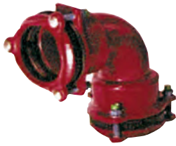
Multijoint 3000. Trækfast bøjning 90 gr. Tætning: EPDM. Syrefaste bolte A4. Vatech nr. 104265.xxx